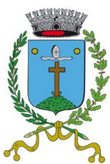
Comune di San Giorgio delle Pertiche