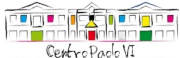
Centro Paolo VI