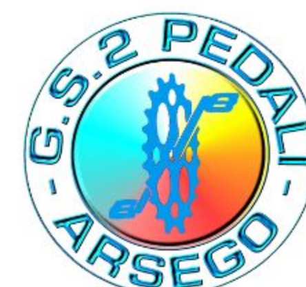
G.S.2 PEDALI ARSEGO