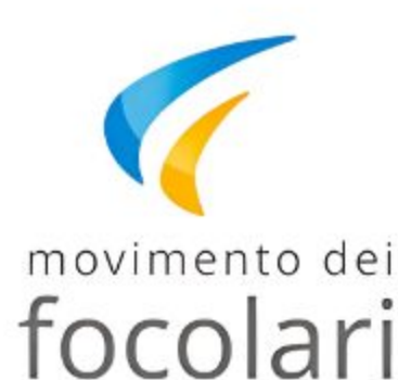
movimento dei focolari