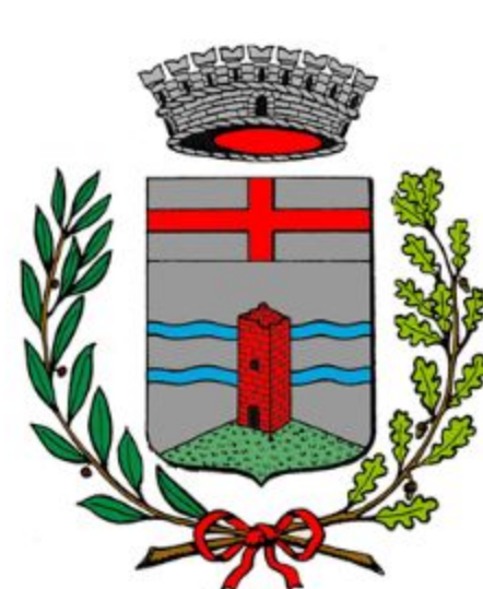
Comune di Santa Giustina in Colle