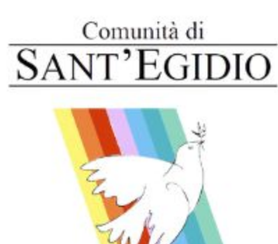
Comunità di SANT'EGIDIO